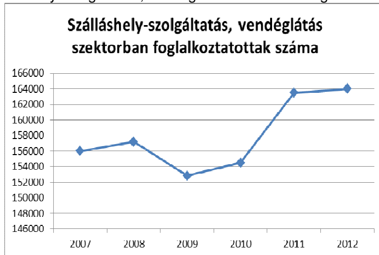
1. ábra: Szálláshely-szolgáltatás, vendéglátás szektorban foglalkoztatottak száma