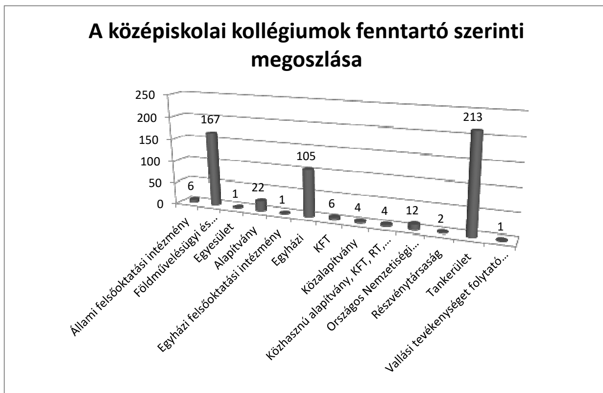
1. ábra. Fenntartók szerinti eloszlás

A 2017. októberi adatszolgáltatás alapján, a decemberben megkapott adatok szerint összesen 47199 tanuló lakik kollégiumban, ahol 3205 pedagógus foglalkozik velük 544 telephelyen 389 intézményben.