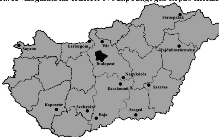
1. ábra. A vizsgálatban érintett óvodapedagógus képző intézmények