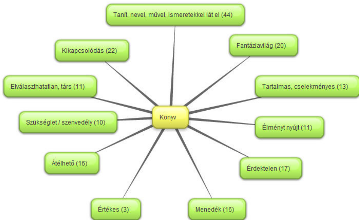
2. ábra. A tanulói metaforák forrástartományai

A strukturált interjúk eredményeképp azt kaptam, hogy a megkérdezettek többsége saját korosztályának olvasási szokásairól negatív képet fest, míg a saját olvasási szokásait attól eltérőnek tartja, vagyis önmagát rendszeres olvasóként tünteti fel, habár ez az olvasás elmondásuk alapján eltér a korábban megszokott, hagyományos, papír alapú olvasástól, esetükben egyre nagyobb teret nyer az elektronikus forma. A tanulók olvasói ízlésével kapcsolatos legfontosabb következtetésem az volt, hogy az általuk egy olvasmány kapcsán fontosnak tartott jellemzők teljes ellentmondásban vannak azokkal a tulajdonságokkal, melyekkel a kötelező olvasmányokat jellemezték. Az általuk ideálisnak tartott olvasmányok izgalmasak, fordulatosak, pörgősek, haladásak, nem hosszadalmasak, nem túl részletezők, érdekesek, figyelemfelkeltők, tanulságosak, újat mondanak, megmozgatják a fantáziát, humorosak vagy titokzatosak (l. 3. ábra). Nem úgy, mint a kötelező olvasmányok, melyek véleményük szerint unalmasak, hosszúak, lassúak, nehezen bontakozik ki a lényegük, túl sok leíró,